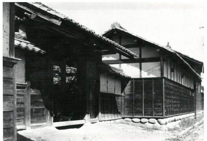
『有隣舎 昭和13年頃撮影』 1981年 PA/2/100

かつて日本には寺子屋・藩校・私塾などの多様な 学び舎が存在しました。一宮では、数多くの文人が 学んだ私塾「有隣舎 ゆうりんしゃ 」が代表的です。 ここでは、一宮の教育や学校の歴史を調べるために 参考になる資料やインターネットの情報について 紹介します。