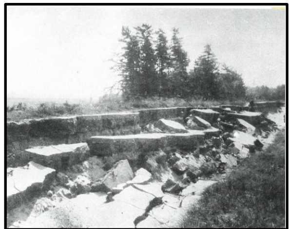
『木曾川堤防破壊 濃尾震災（明治24年10月28日）』 1992年 P7/1/5

インターネット、データベースもご活用ください。7階インターネットスペースではデータベースを利用して、新聞記事や国立国会図書館のデジタル資料が検索できます。