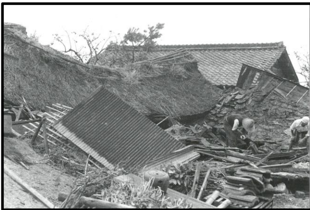
『伊勢湾台風 S34. 9. 26 倒壊家屋』 1981年 P3/4/71

ここでは、一宮市の自然災害について調べるために参考になる資料やインターネットの情報について紹介します。