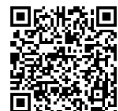
川西市立中央図書館 Web サイト

川西市電子図書館 https://web.d-library.jp/kawanishi/g0101/top/