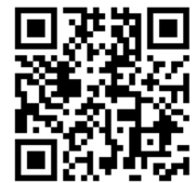
川西市電子図書館

川西市電子図書館に入りました新着資料の一部をご紹介します。川西市の図書館カードをお持ちの方で、川西市在住・在勤・在学の方が電子図書館を利用できます。右のQRコードからご利用ください。